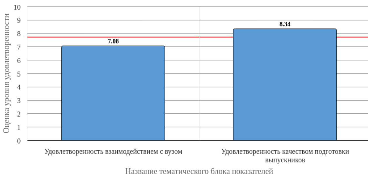
Рисунок 2.1 - Средняя оценка удовлетворенности (по тематическим блокам показателей)

Средняя оценка удовлетворенности респондентов по блоку вопросов «Удовлетворенность взаимодействием с вузом» равна 7.08, что является показателем повышенного уровня удовлетворенности (50-75%).